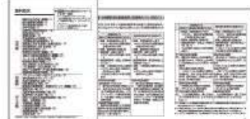
運行管理に必要な情報をまとめた資料ページ

運行管理に必要な法令や、知っておきたい知識を厳選し「法令編」「知識編」「データ編」としてまとめています。一部の資料につきましてはWEBサイトよりダウンロードしていただけます。