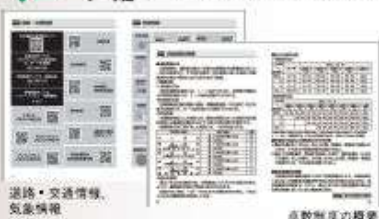
道路・交通情報、気象情報