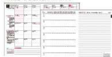
機能性に優れたカレンダーでスケジュール管理も万全

カレンダー欄には、日々の運行管理のヒントとなる「重点指導項目」「管理ごよみ」「日出・日入の時刻」などを掲載しています。