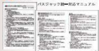
バスジャック統一対応マニュアル