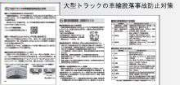
大型トラックの車輪脱落事故防止対策