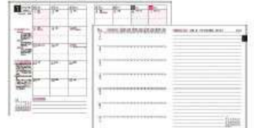
機能性に優れたカレンダーでスケジュール管理も万全

カレンダー欄には、日々の運行管理のヒントとなる「重点指導項目」「管理ごよみ」「日出・日入の時刻」などを掲載しています。