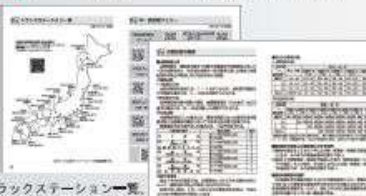
トラックステーション一覧