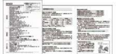
運行管理に必要な情報をまとめた資料ページ

運行管理に必要な法令や、知っておきたい知識を厳選し「法令編」「知識編」「データ編」としてまとめています。一部の資料につきましてはWEBサイトよりダウンロードしていただけます。